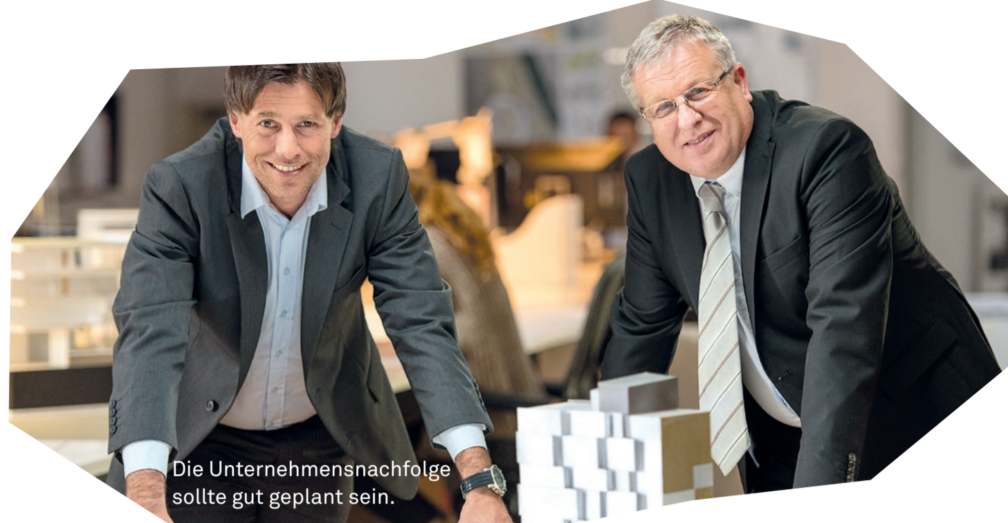
Die Unternehmensnachfolge sollte gut geplant sein.

In vielen KMU stellt das Unternehmen einen wesentlichen Teil des Vermögens der Unternehmerin oder des Unternehmers dar, so dass ein späterer Ausgleich der weiteren Erben nicht möglich ist oder die übergebende Generation nicht genügend Mittel hat, um eine angemessene Altersvorsorge zu gewährleisten, wenn sie nicht aus dem Verkauf ihrer Unternehmung einen Erlös erhält. Eine vollständige oder teilweise unentgeltliche Übertragung der Unternehmung ist in diesen Fällen nicht möglich oder nicht gewollt. Kauft die familieninterne Nachfolgerin die Unternehmung zum Marktpreis und wird dieser Kaufpreis auf Basis einer neutralen Unternehmensbewertung festgesetzt, stellt sich erbrechtlich kaum die Frage nach einer Pflichtteilsverletzung oder einer Ungleichbehandlung der künftigen Erben. Hingegen birgt die Variante «familieninterner Verkauf» häufig Finanzierungsprobleme, wenn die Nachfolgerin oder der Nachfolger nicht in der Lage ist, den Kaufpreis aus eigenen Mitteln oder über eine Bankfinanzierung aufzubringen. Dann ist die Restfinanzierung mittels eines zu amortisierenden Verkäufers-